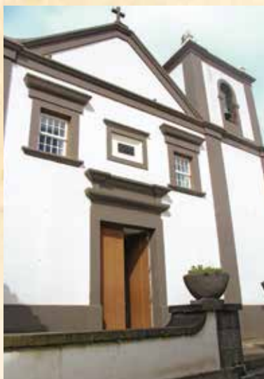
3 Igreja Matriz, único templo da Ilha, edificada no século XVIII e dedicada a Nossa Senhora dos Milagres

Seguir depois pela Rua da Matriz , em direção a norte , onde se pode visitar a