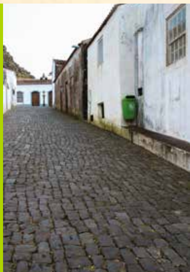
Ladeira do Outeiro em outubro de 2012